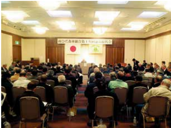
出席いただいた総代様